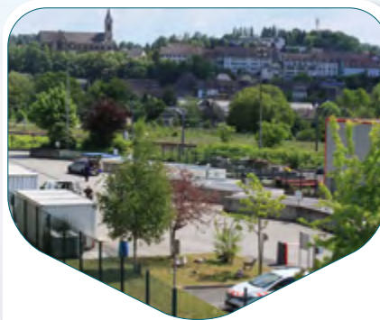
ALTKIRCH ZA Nord Altkirch-Carspach

Le véhicule est pesé à l'entrée puis à la sortie de la déchèterie et le poids déposé est facturé 0,15 €/kg .