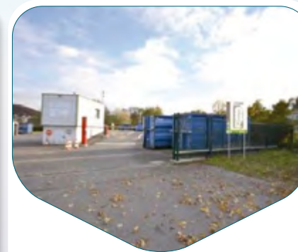
ILLFURTH Route de Spechbach