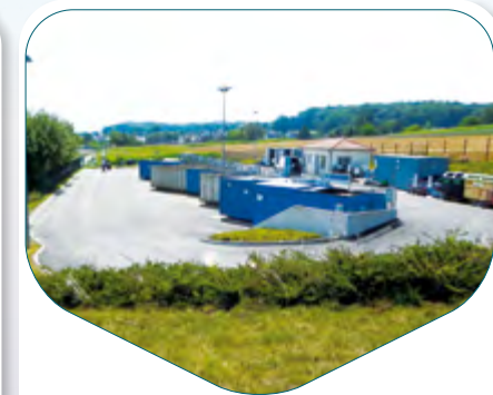
WALDIGHOFFEN Rue de l'Artisanat

Un portique limite la hauteur des véhicules à 2m20 .